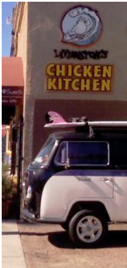
Amputert buss Agder kollektivtrafikk legger nå opp til et lokalbusstilbud som ikke fortjener navnet og hverken ligner fugl eller fisk.

Min kommentar til Agder Kollektivtrafikks planer om drastisk reduksjon av lokalbusstilbudet på øya: